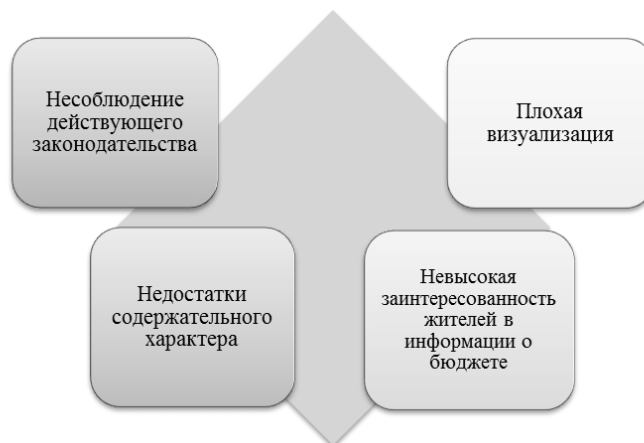
Рисунок 2. Проблемы представления бюджета для граждан

К первой группе относятся недостатки, касающиеся несоблюдения Приказа Минфина России от 22.09.2015 № 145н. При составлении бюджета для граждан необходимо руководствоваться принципами, указанными в Методических рекомендациях, и следовать установленной структуре и составу бюджета для граждан. Главная задача, она же и проблема финансовых органов – качественный отбор ключевой информации и упрощенное ее изложение.