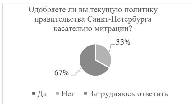
Рисунок 8. Одобрение миграционной политики правительства Санкт-Петербурга

статистика свидетельствует о наличии в обществе негативного отношения к росту темпов трудовой миграции.