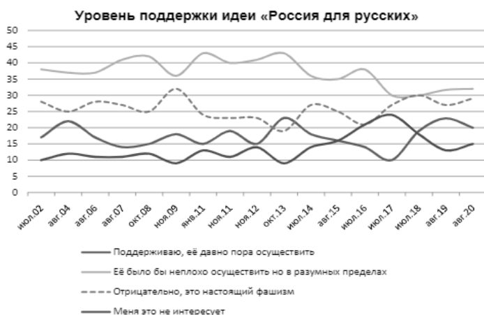
Рисунок 3. Статистика уровня поддержки гражданами РФ идеи «Россия для русских» за последние 18 лет [13]

Ниже, на рисунке 4, приведена любопытная статистика Левада-Центра касательно отношения граждан РФ к националистической идее «Россия для русских». Как видно на графике, количество граждан, поддерживающих данную идею за последние 3 года немного возросло.