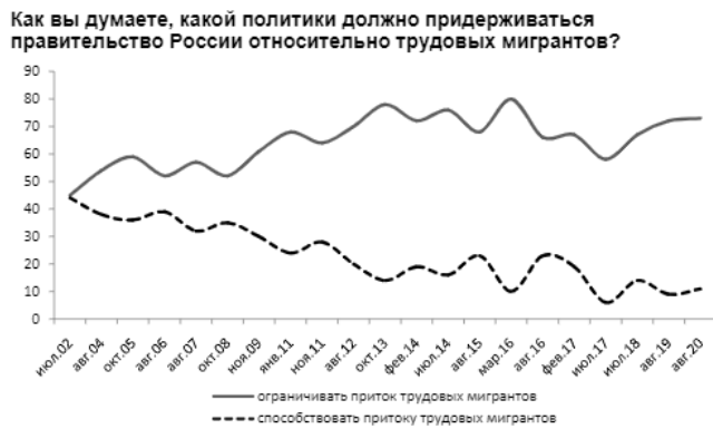
Рисунок 6. Статистика мнения россиян о миграционной политике страны в виде графика за последние 18 лет [13]

На графике видно, что за последние 18 лет количество россиян, считающих необходимым ограничивать приток рабочих мигрантов увеличилось в 1,5 раза, а число граждан, лояльных к трудовым мигрантам снизилось соответственно в том же объеме.