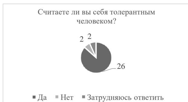
Рисунок 9. Ощущение толерантности среди респондентов

статистика свидетельствует о наличии в обществе негативного отношения к росту темпов трудовой миграции.