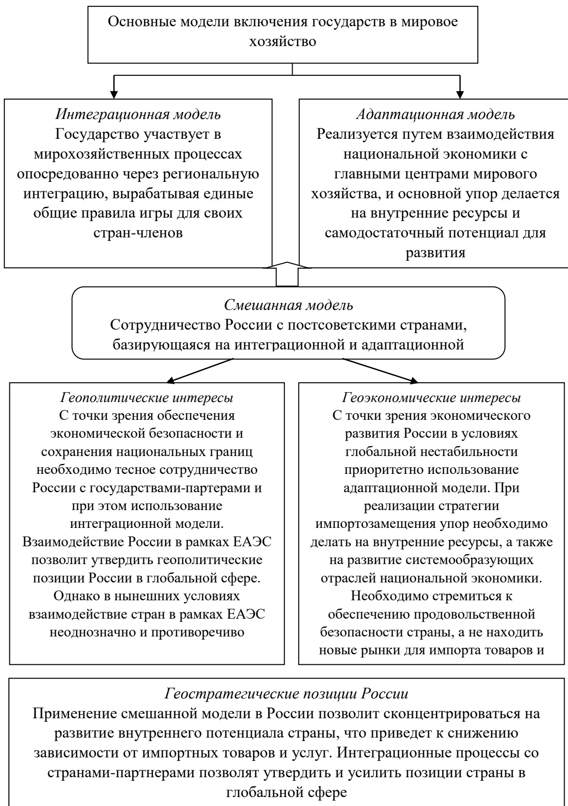
Рисунок 3. Смешанная модель сотрудничества России с постсоветскими странами, базирующаяся на интеграционной и адаптационной моделях (составлено автором по материалам [5, с.445-460])

Предложена форма внешнеэкономического взаимодействия стран-партнеров – геостратегический экономический блок.