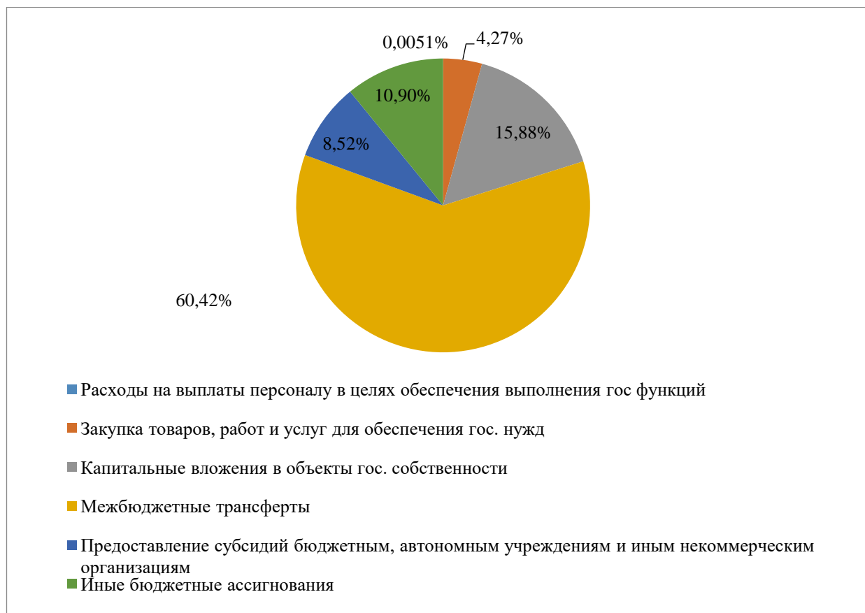
Рисунок 1. Структура государственных ассигнований в 2019 году.

Финансовая поддержка может быть выражена в форме бюджетных ассигнований федерального бюджета, бюджетов субъектов Российской Федерации, местных бюджетов путем предоставления субсидий. В 2019 году предоставление субсидий бюджетным, автономным учреждениям и иным некоммерческим организациям составили 8,52% от общего числа бюджетных ассигнований или 165 812,1 млн. руб. [4].