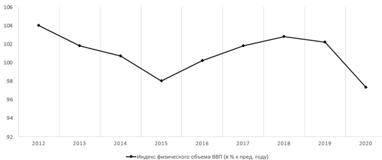
Рисунок 1. Индекс физического объема ВВП России в 2012-2020 гг., % к предыдущему году [6]

Далее были проанализированы некоторые макроэкономические показатели России. Если рассматривать состояние современной экономики РФ, отмечается темп роста ВВП (индекс физического объема ВВП, %) в 2012-2020 гг. не более 4,00%. Более того, наблюдаются и отрицательные значения, как, например, в 2020 году, что вполне могло быть связано с эпидемией COVID-19, снижением экономической активности ряда граждан и организаций, что отражено на рисунке 1 [8].