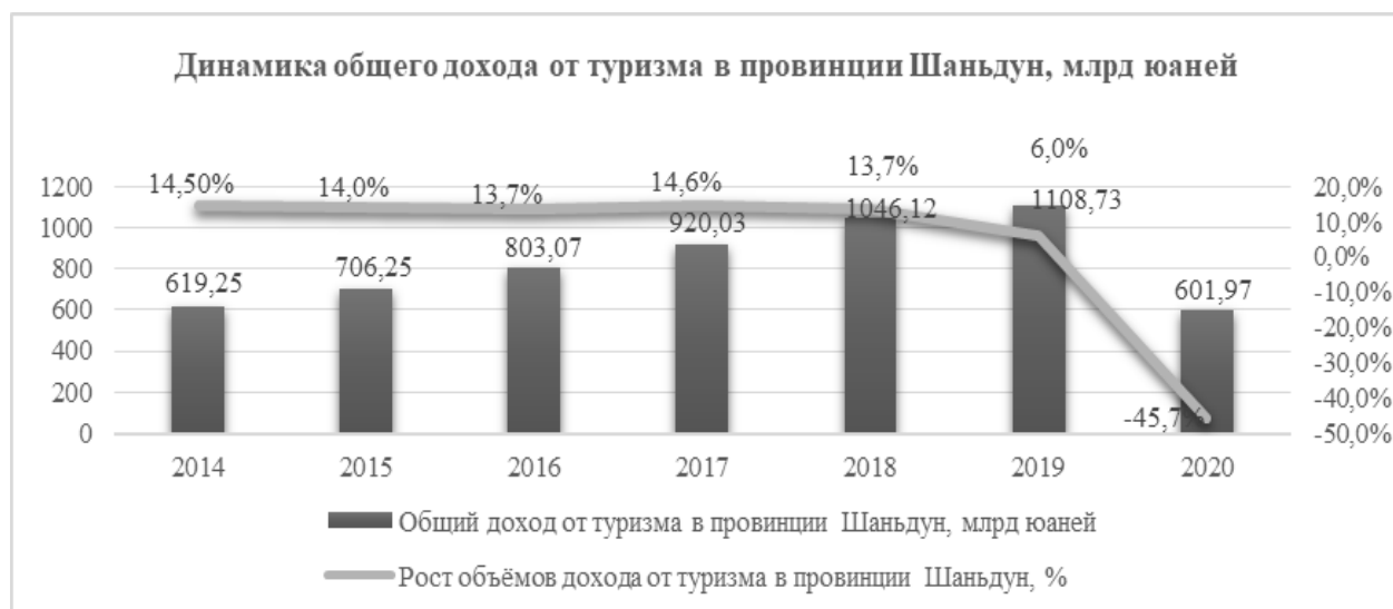
Рисунок 1. Динамика общего дохода от туризма в провинции Шаньдун [4;10]

Для определения вклада туризма в экономику провинции Шаньдун в данном исследовании взят коэффициент локализации ( K_L ). Коэффициент локализации выявляет отрасли специализации региона с помощью сопоставления отраслевой структуры региона с отраслевой структурой базовой территории. В данном случае в качестве региона была взята провинция Шаньдун, а в качестве базовой территории – Китай. Отрасль считается отраслью специализации для региона, если K_L > 1 . Причём чем больше значение K_L , тем больше концентрация данной отрасли в регионе. Коэффициент локализации рассчитывается по формуле: